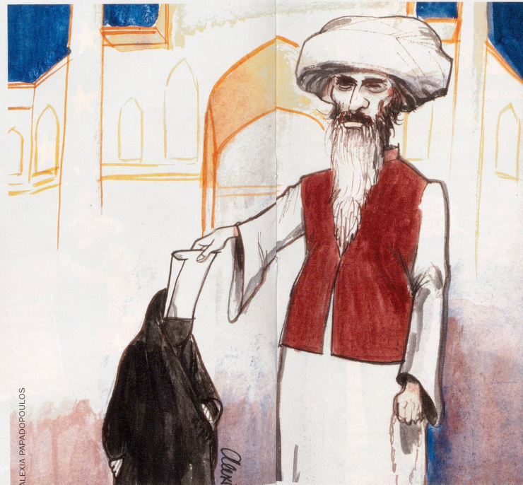
Wahlen im Iran: Klarer Sieg für die Konservativen.