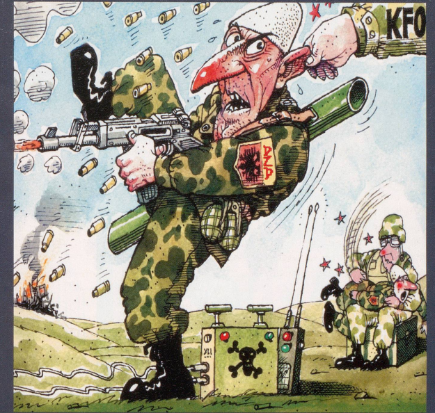
Irgend etwas klappt einfach nicht im Kosovo.