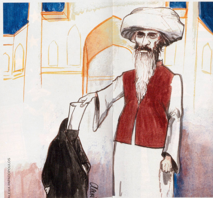
Wahlen im Iran: Klarer Sieg für die Konservativen.