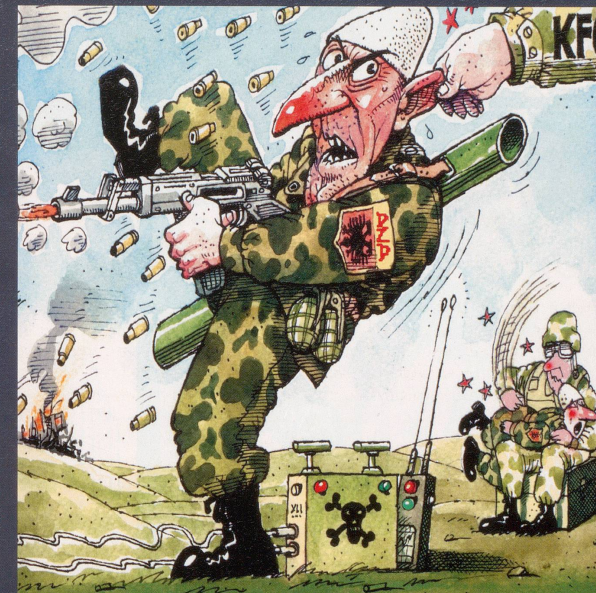
Irgend etwas klappt einfach nicht im Kosovo.