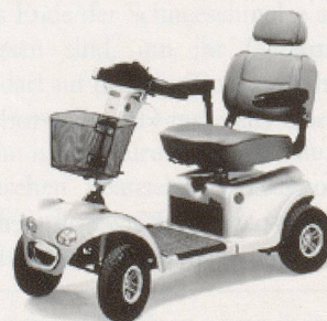
Modell 889-XLS Deluxe

Verlangen Sie Ihr unverbindliches Angebot