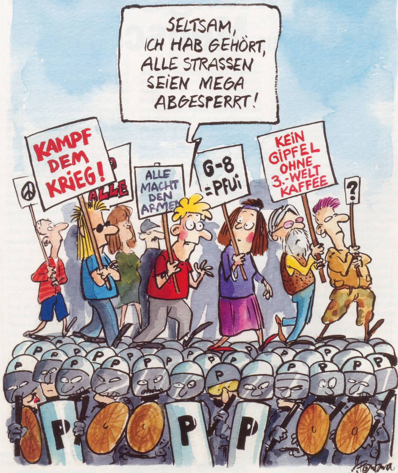
Falsche Gipfel-Stürmer? Ein riesiger Aufmarsch an Polizei soll die Genfersee-Region während des G-8-Gipfels in Evian vor verärgerten Gipfel-Gegnern schützen.