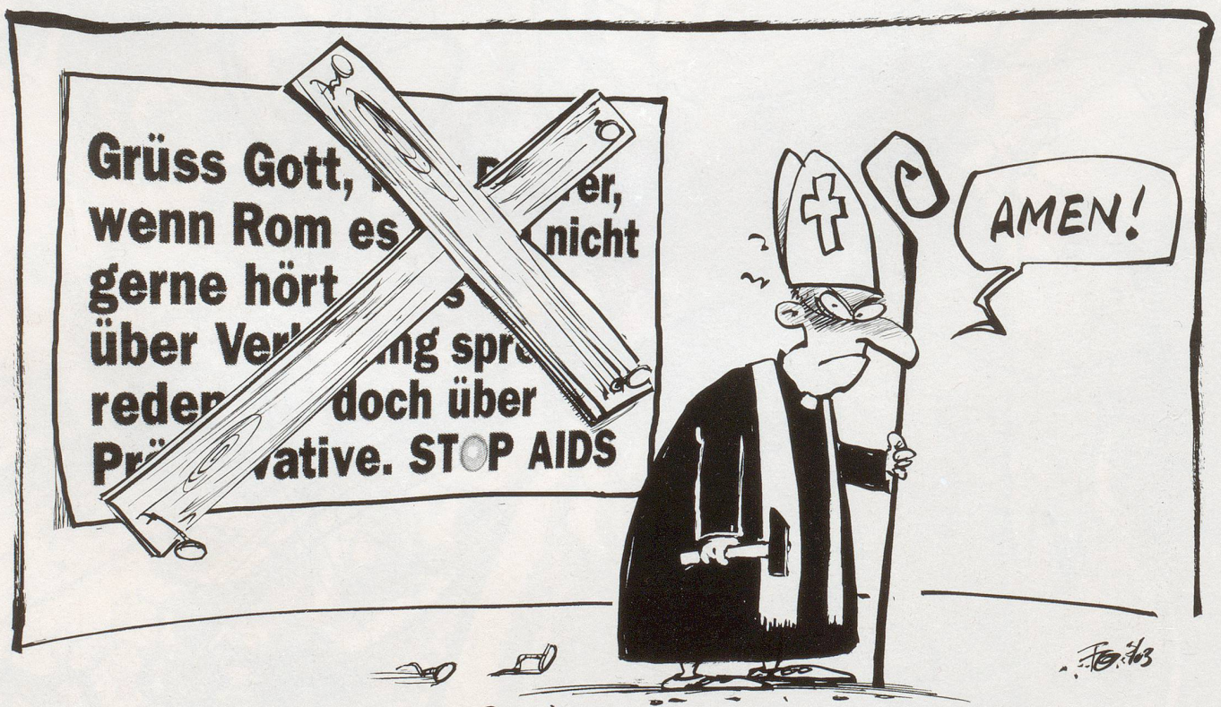
Falsche Moral: Auf Druck der Schweizer Bischofskonferenz zieht das Bundesamt für Gesundheit (BAG) ein umstrittenes Plakat aus der Aids-Kampagne zurück. Da hilft nur Beten ...