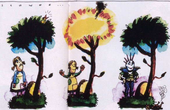
Bäumchen, Bäumchen schlie dich: Wurf Lack und Leder über mich!

Ich erschrecke mit Geschlotter! Wer legt Potter eine Schlinge? Andrer Film auf gleicher Strecke! Weh, es singt «Der Herr der Ringe»!