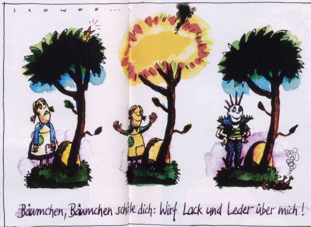
Bäumchen, Bäumchen schütze dich: Wurf Lack und Leder über mich!

Hat der alte Krittmeister endlich sich zur Ruh begeben! Und nun können meine Geister in gedruckten Büchern leben. Unbekannt, voll Sorgen, war ich lange Jahr'. Doch von heut auf morgen wurde ich ein Star!