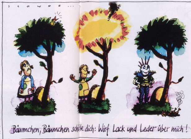
Bäumchen, Bäumchen schlie dich: Wurf Lack und Leder über mich!

Hat der alte Krittelmeister endlich sich zur Ruh begeben! Und nun können meine Geister in gedruckten Büchern leben. Unbekannt, voll Sorgen, war ich lange Jahr'. Doch von heut auf morgen wurde ich ein Star!