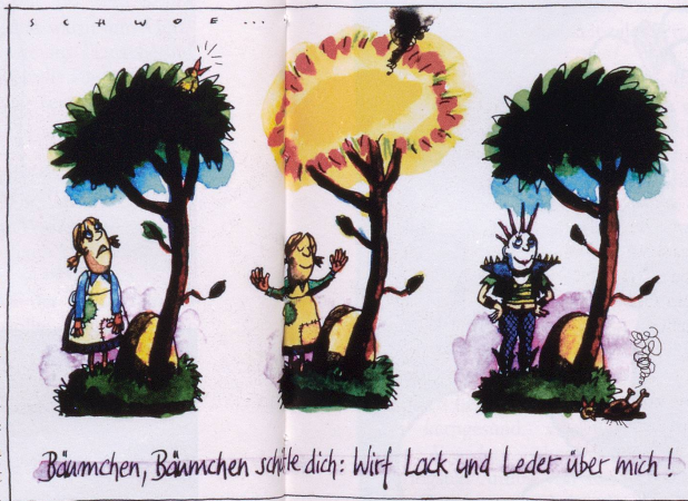
Bäumchen, Bäumchen schütze dich: Wurf Lack und Leder über mich!

Hat der alte Krittelmeister endlich sich zur Ruh begeben! Und nun können meine Geister in gedruckten Büchern leben. Unbekannt, voll Sorgen, war ich lange Jahr'. Doch von heut auf morgen wurde ich ein Star!