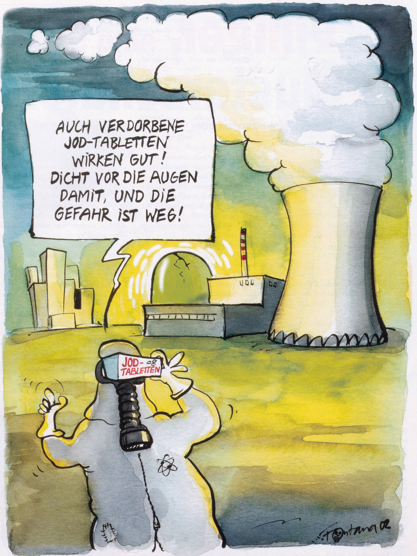
Restrisiko? Das Verfalldatum der in AKW-Nähe abgegebenen Jod-Tabletten ist überschritten. Sie werden aber vorerst nicht ersetzt.