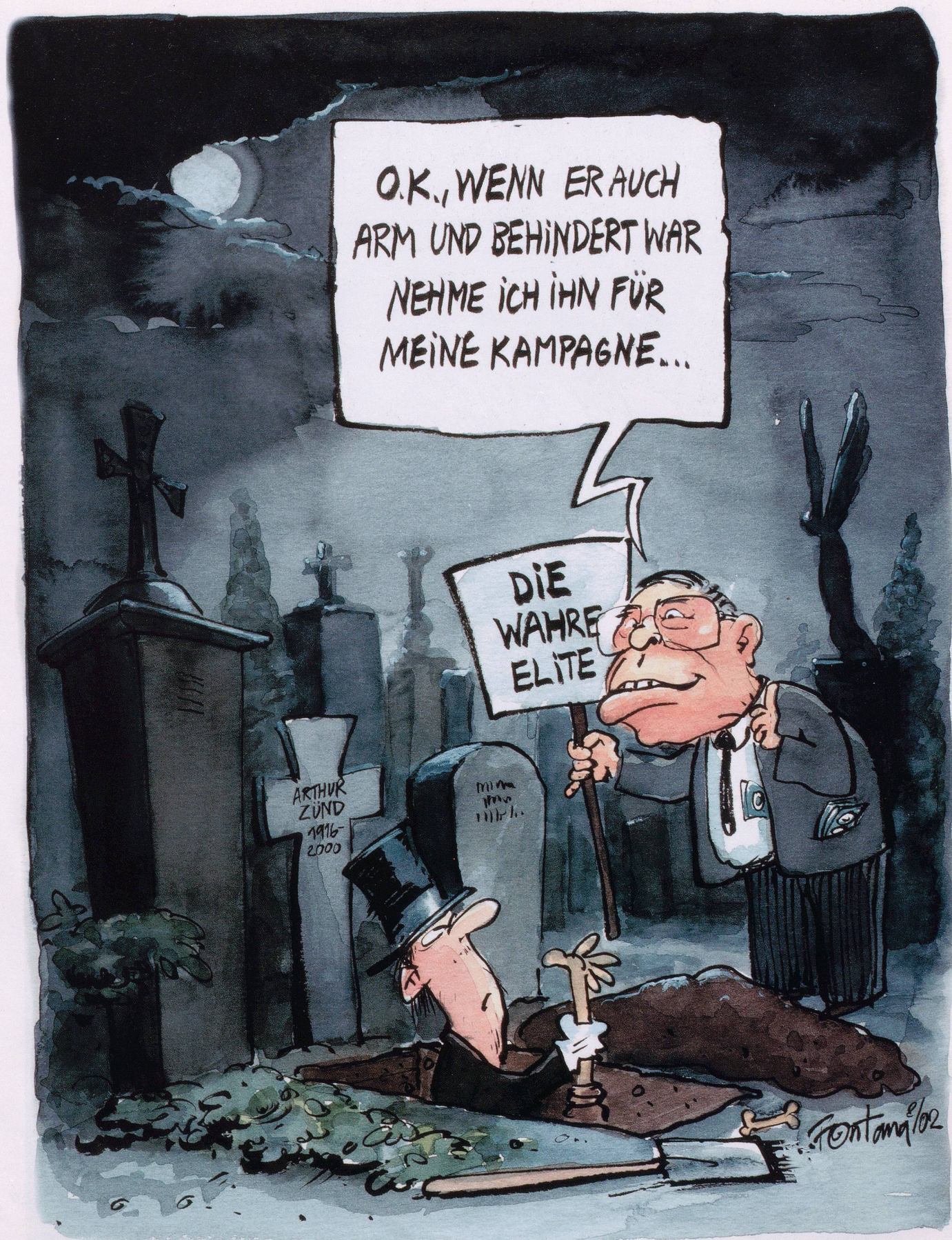
Voll daneben. Der geistig behinderte Hausierer A.Z. (verstorben 2000) wird von Chr. Blocher zum Volksheld idealisiert und für die Anti-Uno-Kampagne missbraucht.