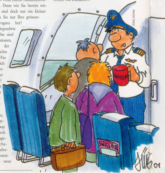
«Darf ich noch um eine kleine Spende bitten?»

Firma soll nun, so der Bund, die Banken und die Industrie wollen, wie einst Phönix aus der Asche zu neuem Leben erweckt werden.» «Und wie in aller Welt wollen Sie das bewerkstelligen?» «Unser traditionell-schweizerischer Tourismus mit seinem Alphorn- und Edelweiss-Image dümpelt so gemächlich dahin, an revolutionär-visionären Ideen hapert es ganz erheblich. Unter der Ägide von Topshots aus der monetären Businesswelt und unter Berücksichtigung von supermerkantilistischem Kalkül soll das grösste europäische multikulturelle Airline Grounding World and Game Center entstehen. Zudem möchten wir Disney World, Hollywood und Las Vegas an unserem Projekt kreativ mitgestalten.» «Moment mal! Haben Sie öfter derart himmrissige Sciencefiction-Wahnideen?» «Das ist kein Wahn! Das ist eine zukunftsweisende Überlebensstrategie für Schweiz Tourismus. Unsere Devise lautet: Wie schlage ich aus gestrauchelten Firmen Kapital zur Förderung und Sicherung unserer bald noch einzig verbleibenden Ressource Tourismus.» «Sagen Sie, wie war doch gleich Ihr Name?» «Erich von Däniken...»