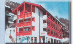
Hotel Artemis ★★★ Tel. 027 957 32 01