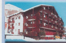
Hotel Saaserhof ★★★★ Tel. 027 957 35 51