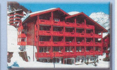
Hotel Schweizerhof ★★★★ Tel. 027 957 51 59

Tolle Ski- und Fun- Pauschalwochen mit 7 Tage Halbpension und 6 Tage Skipass ab CHF 820.- in den ★★★ Hotels ab CHF 890.- in den ★★★★ Hotels