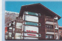
Hotel Europa ★★★ Tel. 027 957 31 91

SAAS-FEE IM WALLIS- AUTOFREI UND SCHNEESICHER