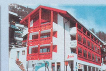
Hotel Artemis *** Tel. 027 957 32 01