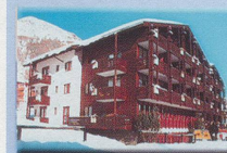
Hotel Saaserhof **** Tel. 027 957 35 51