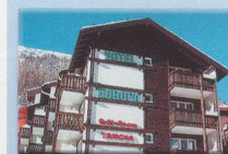
Hotel Europa *** Tel. 027 957 31 91

SAAS-FEE IM WALLIS- AUTOFREI UND SCHNEESICHER