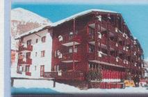
Hotel Saaserhof ★★★★ Tel. 027 957 35 51