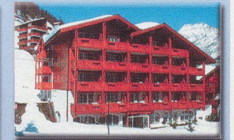
Hotel Schweizerhof ★★★★ Tel. 027 957 51 59

Tolle Ski- und Fun- Pauschalwochen mit 7 Tage Halbpension und 6 Tage Skipass ab CHF 820.- in den ★★★ Hotels ab CHF 890.- in den ★★★★ Hotels