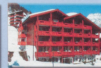
Hotel Schweizerhof **** Tel. 027 957 51 59

Tolle Ski- und Fun- Pauschalwochen mit 7 Tage Halbpension und 6 Tage Skipass ab CHF 820.- in den *** Hotels ab CHF 890.- in den **** Hotels