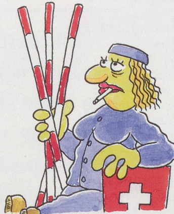
... Neuenburg: "Natur und Künstlichkeit". Künstliche Schilf= halme werden zu authentischen Strassenmarkierungsstangen.

Vom Computer errechnete, etwas kosten= günstigere Synthese aller.