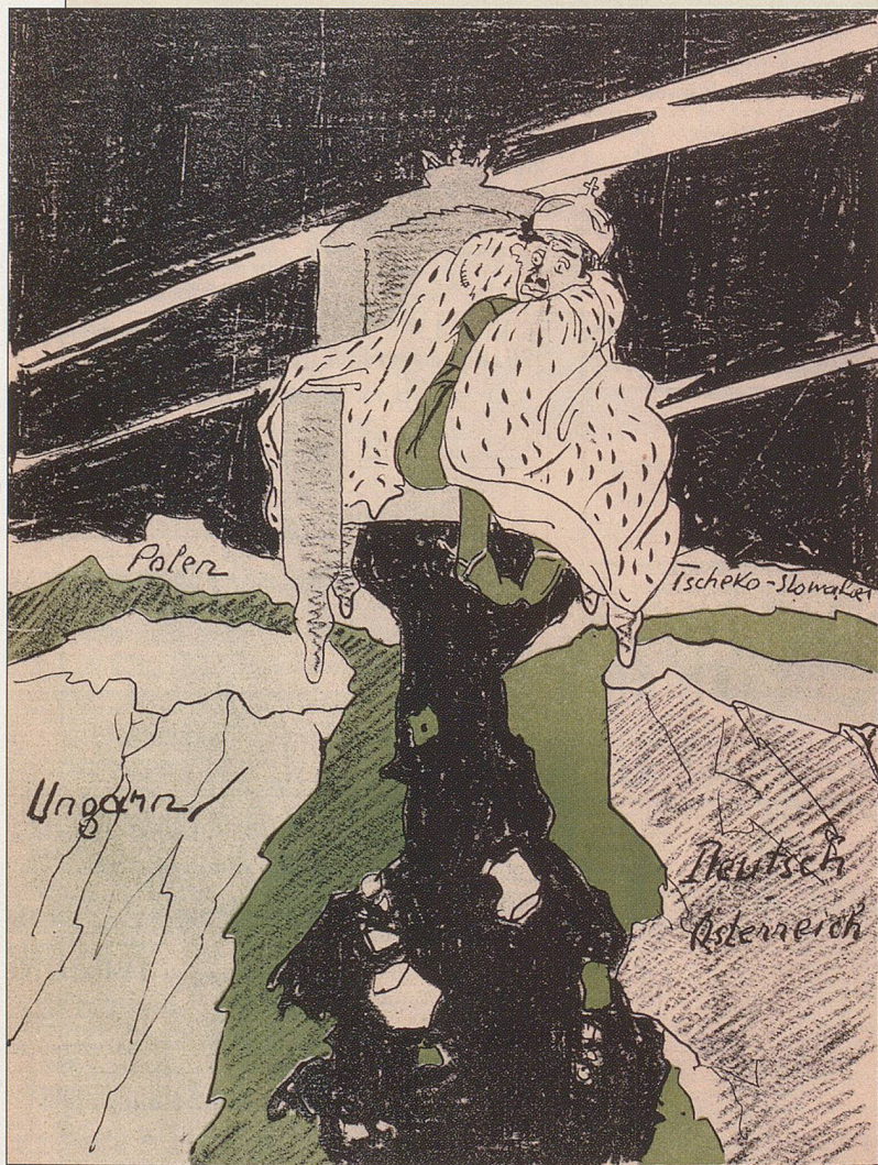
Kaiser Karl I.:

«Wenn ich nur wüsste, auf welche Seite ich mich zu halten habe.»