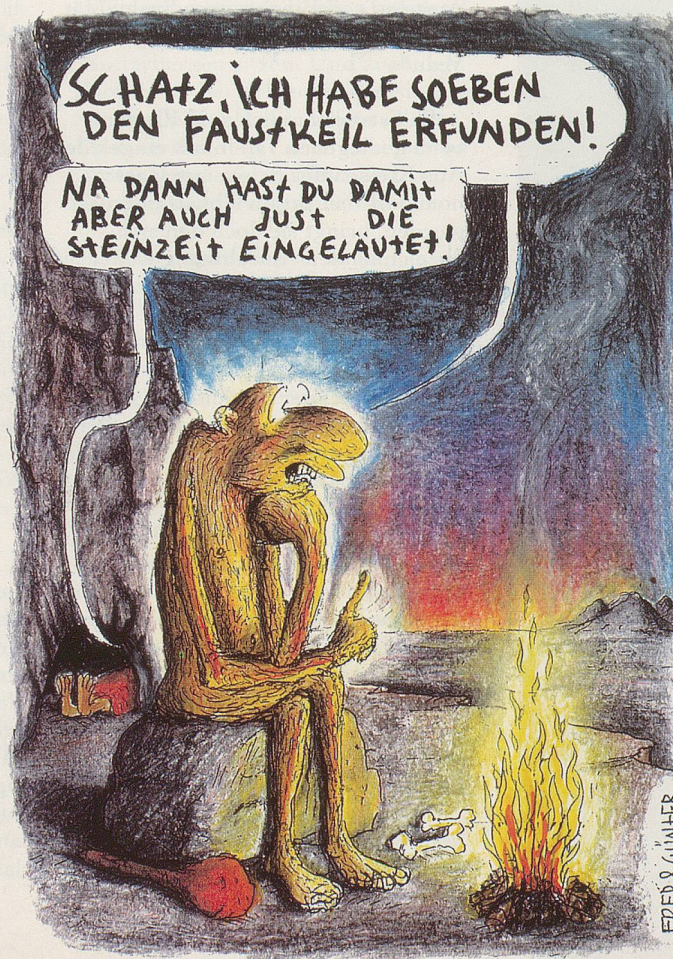
FRED & GÜNTER