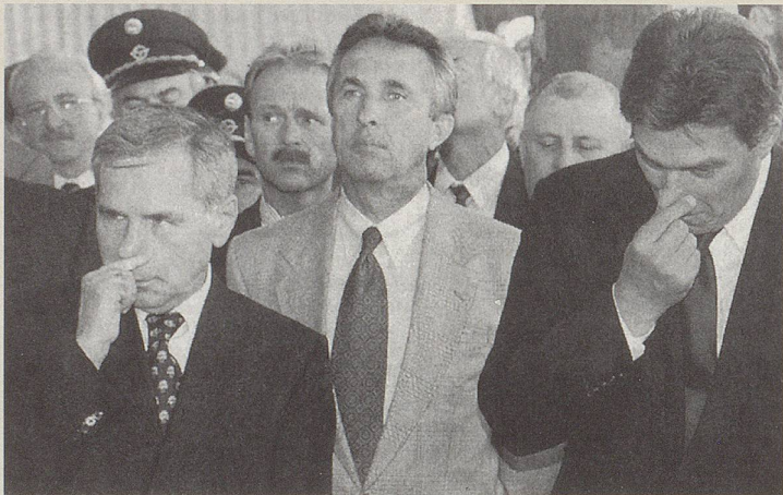
Bundeskanzler Klima (rechts) und Ungarns Premier Horn (links) feiern 125 Jahre österreichisch-ungarische Bahngesellschaft.