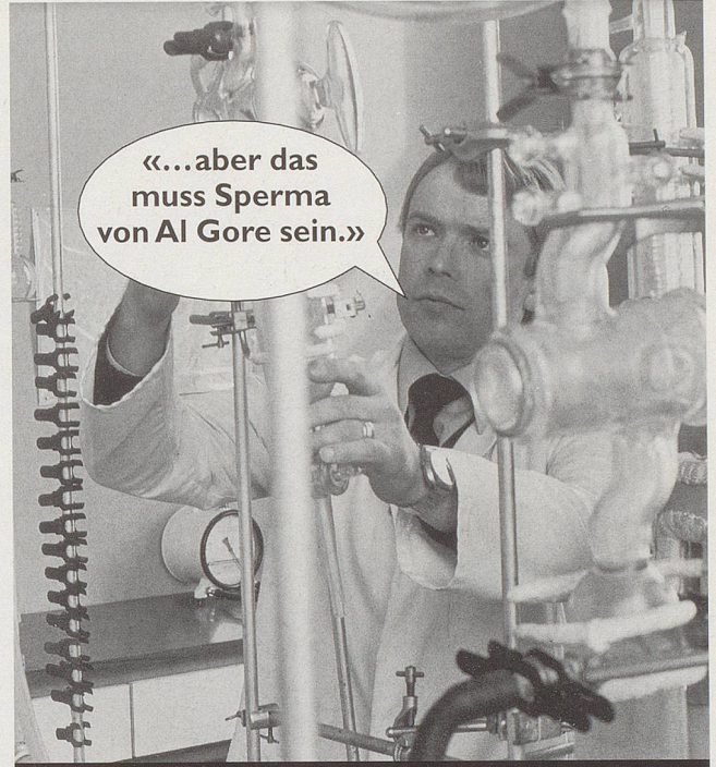
3 Die Macht unwiderstehlicher Reize ...

«...aber das muss Spermia von Al Gore sein.»