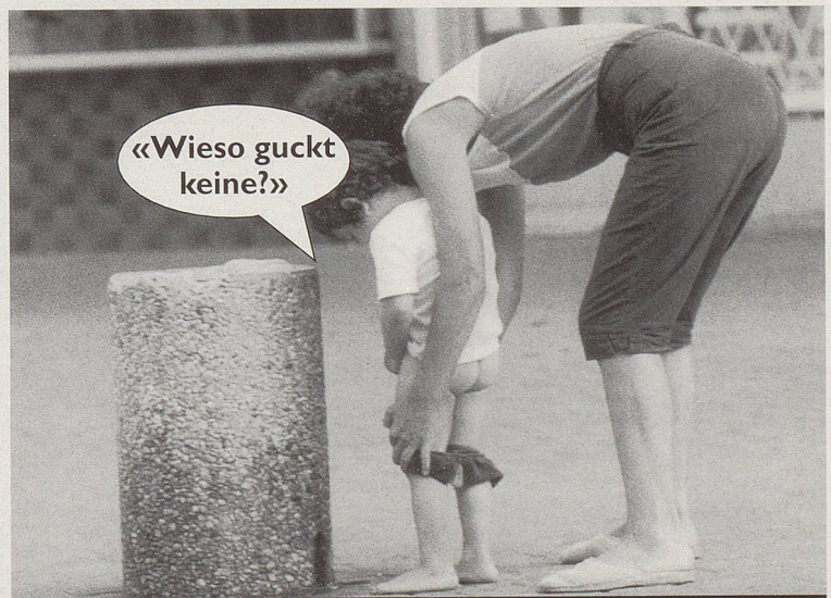
8 ... und mit Hilfe von Psychiatern und Anwälten ...

«Ich spendiere Linda Tripp als kleines Dankeschön einen Lincoln.»