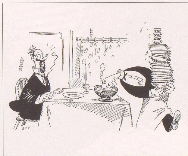
Legende zu Bild Nr. 21