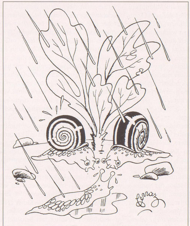
Legende zu Bild Nr. 20