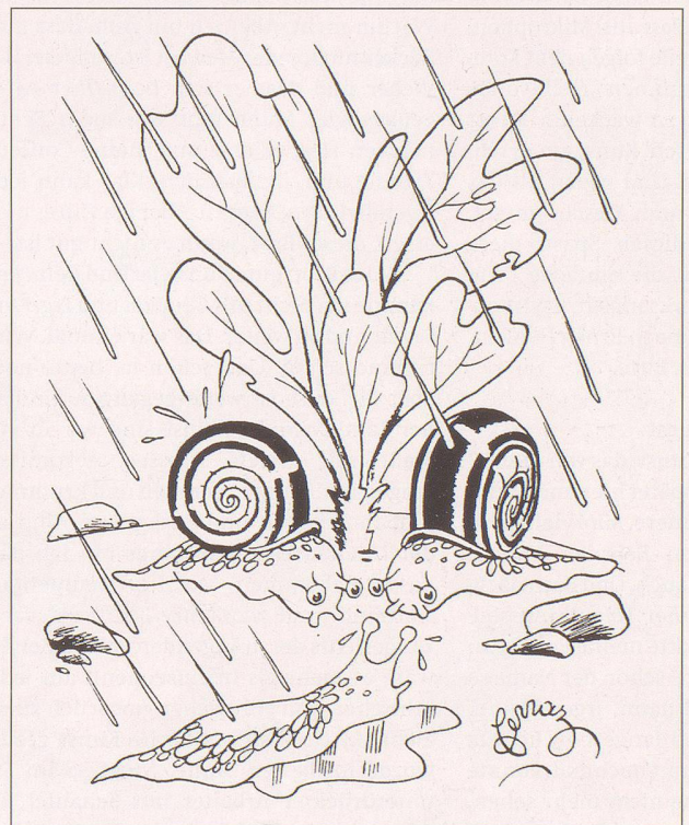
Legende zu Bild Nr. 20