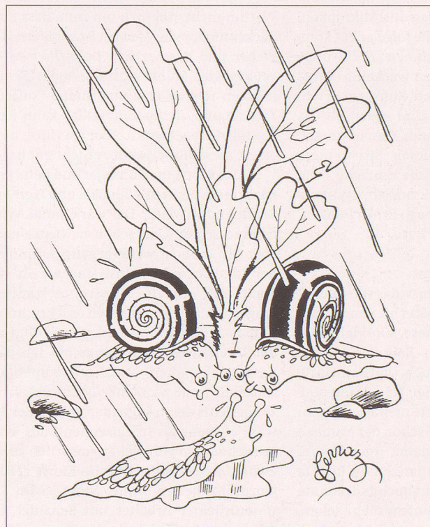
Legende zu Bild Nr. 20