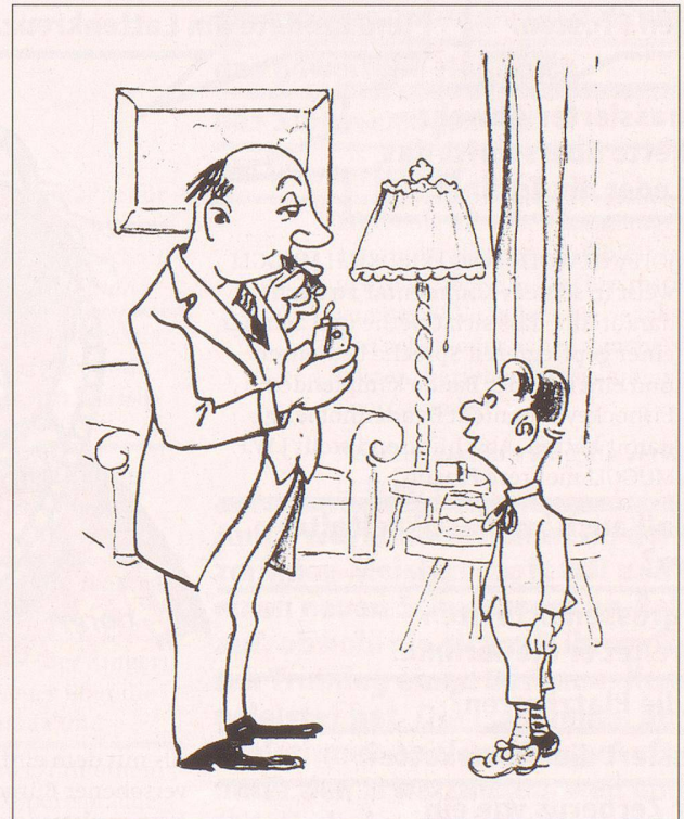
Legende zu Bild Nr. 19