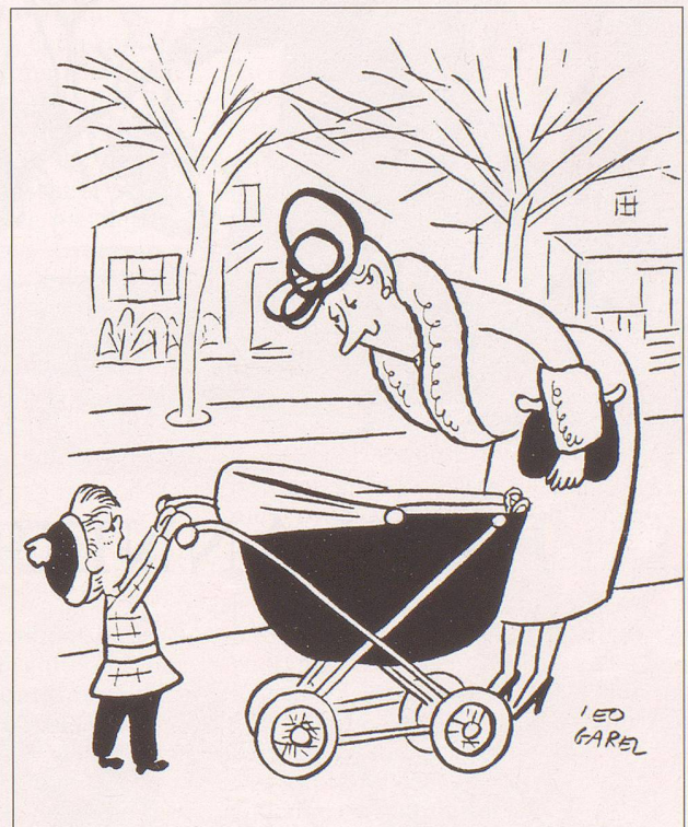
Legende zu Bild Nr. 18