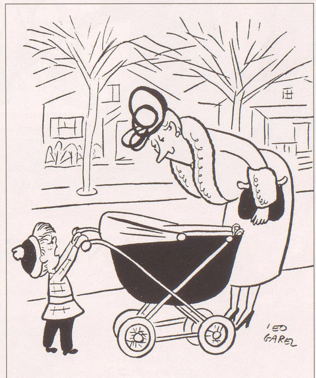
Legende zu Bild Nr. 18