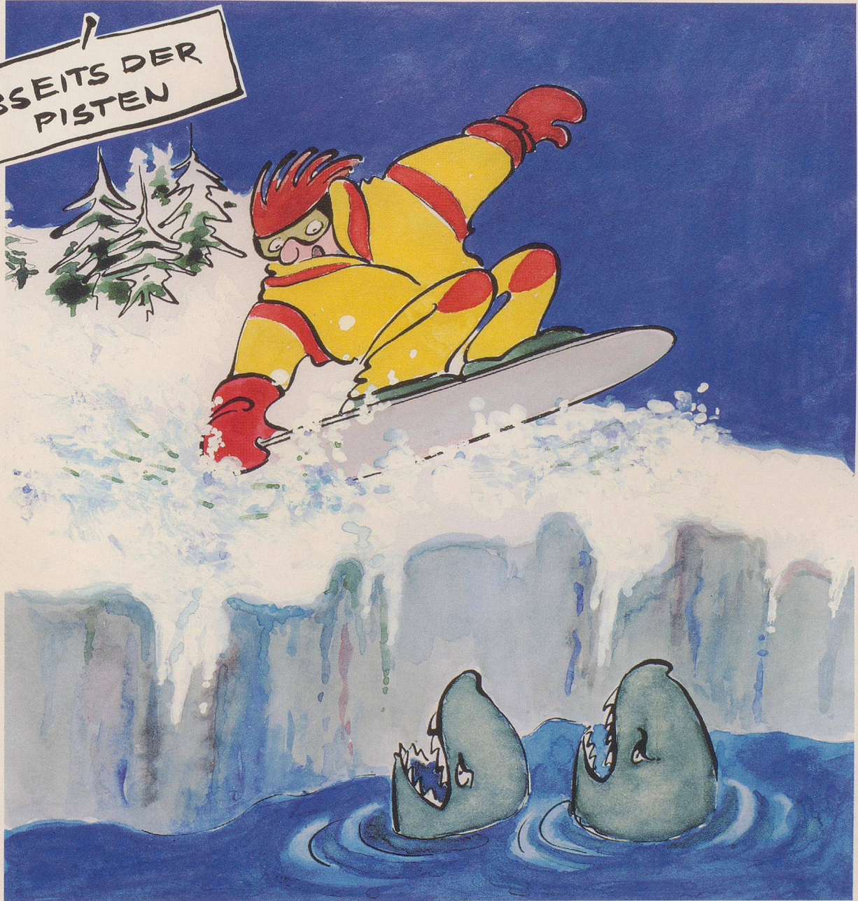
ELENA PINI (ILLUSTRATION), PETER MAIWALD (TEXT)