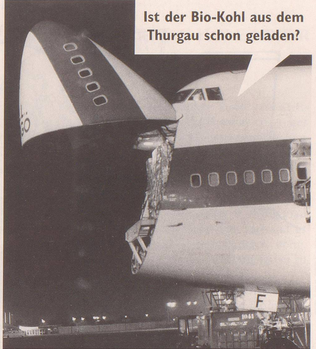
4. ... und stopfen die Rachen der ökonomischen Vögel.

Ist der Bio-Kohl aus dem Thurgau schon geladen?