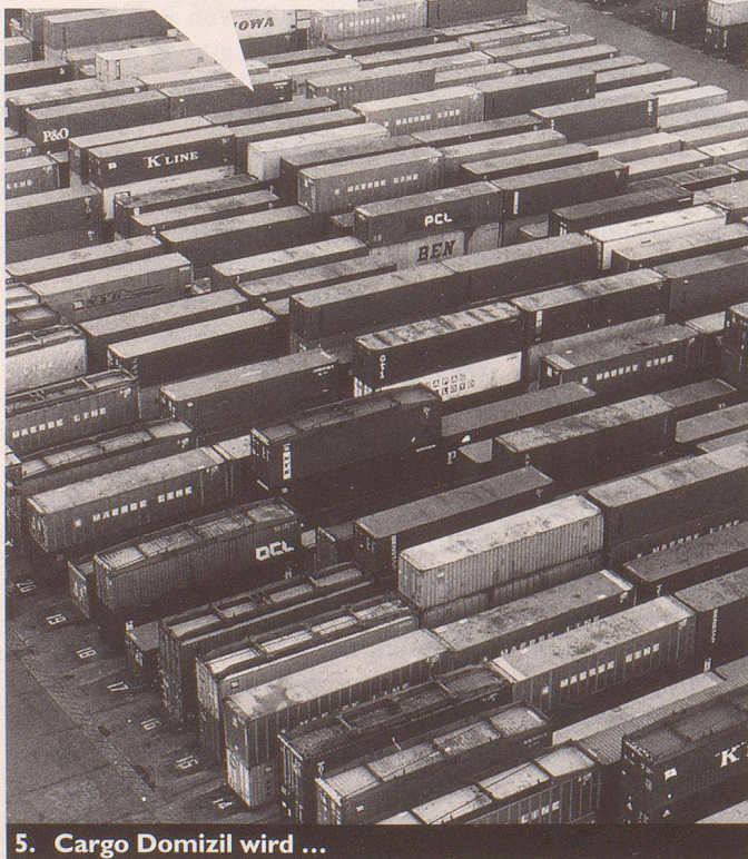
5. Cargo Domizil wird ...