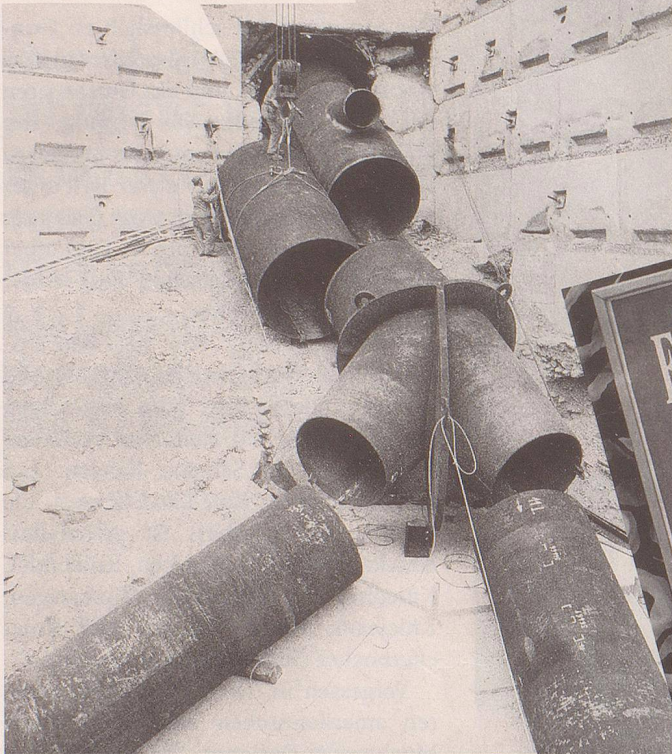
1. Hört auf mit dem teuren NEAT -Wahnsinn!

Ich habe immer gesagt, dass eine Röhre genügt!