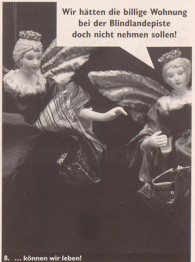
8. ... können wir leben!

Wir hätten die billige Wohnung bei der Blindlandepiste doch nicht nehmen sollen!