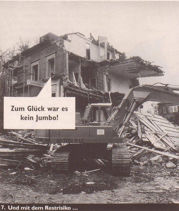
7. Und mit dem Restrisiko ...

Wir hätten die billige Wohnung bei der Blindlandepiste doch nicht nehmen sollen!