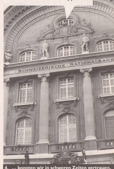
4. ... konnten wir in schweren Zeiten vertrauen.