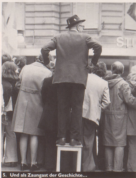
5. Und als Zaungast der Geschichte...