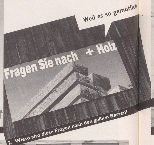
2. Wieso also diese Fragen nach den gelben Barren?