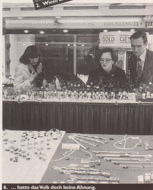
6. ... hatte das Volk doch keine Ahnung.