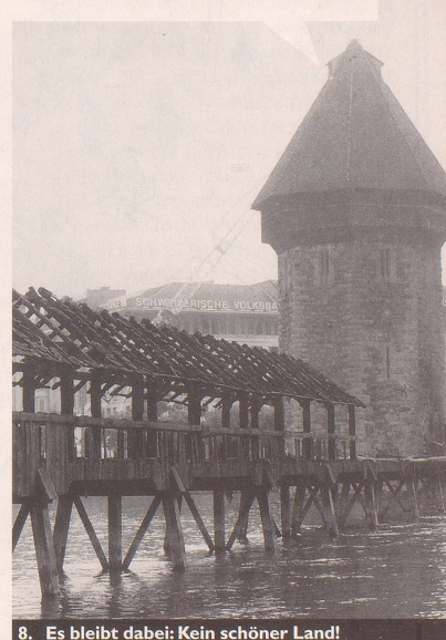
8. Es bleibt dabei: Kein schöner Land!