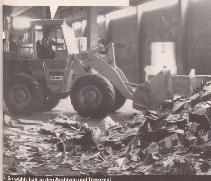
7. So wühlt halt in den Archiven und Tresoren!