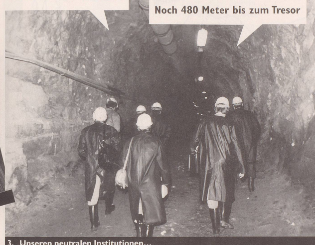
3. Unseren neutralen Institutionen...