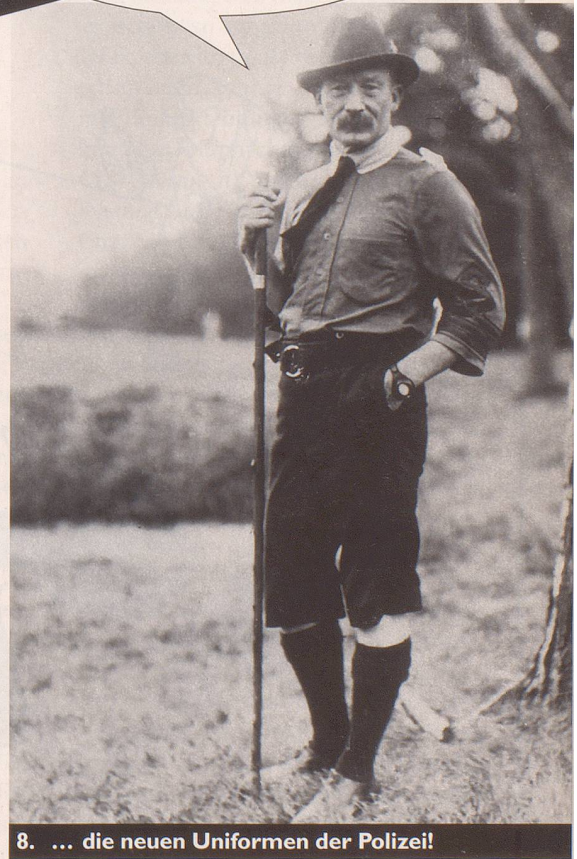
8. ... die neuen Uniformen der Polizei!