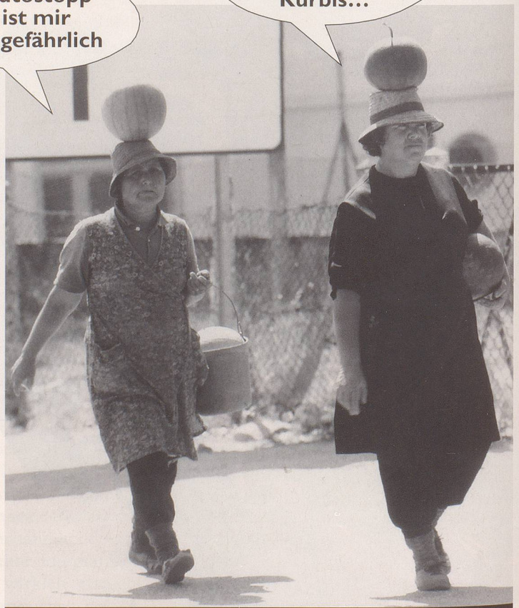
5. Nur Ewiggestrige gehn noch meilenweit...