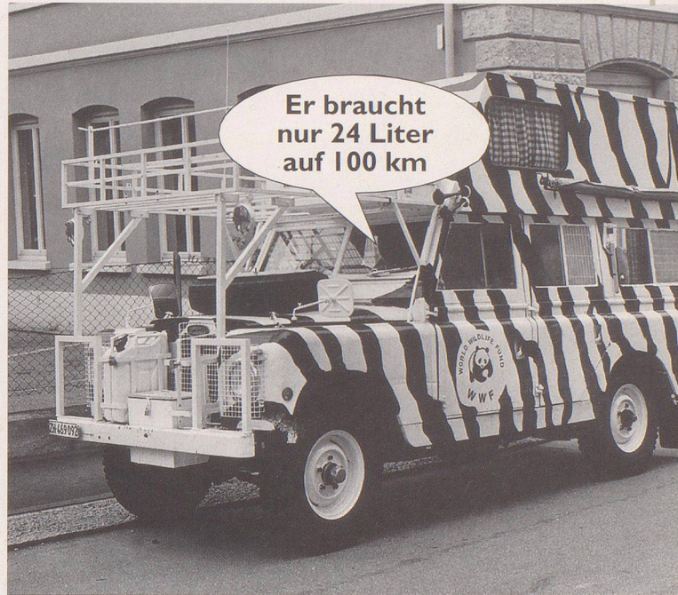
3. ... wie ein Stück Natur.