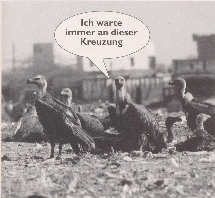
2. ... und die Geschöpfe des Herrn lieben Dich...