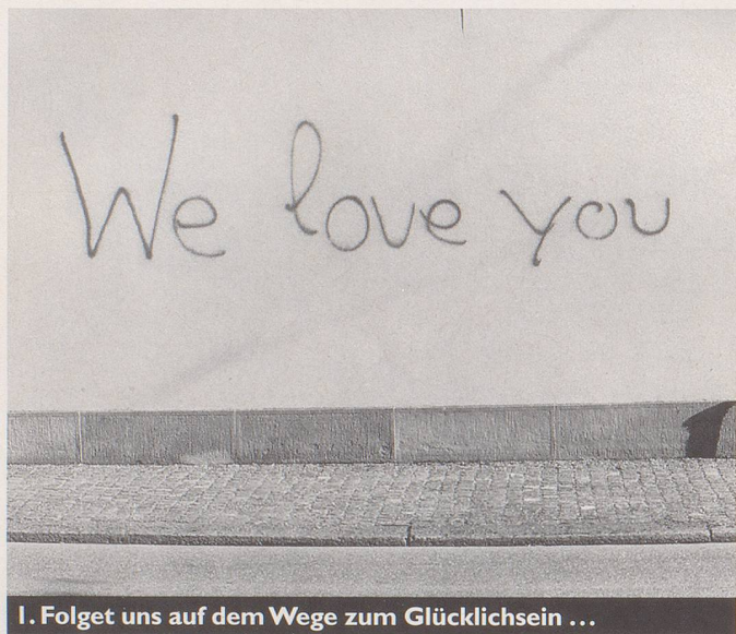
1. Folget uns auf dem Wege zum Glückhsein ...