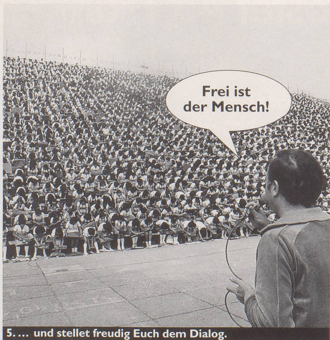
5. ... und stellet freudig Euch dem Dialog.