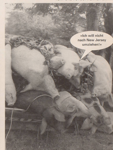
3. ... spüren das die armen Schweine.