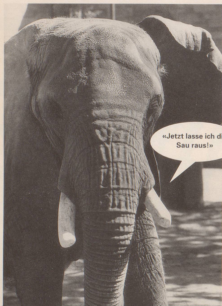
1. Wenn grosse Tiere ...