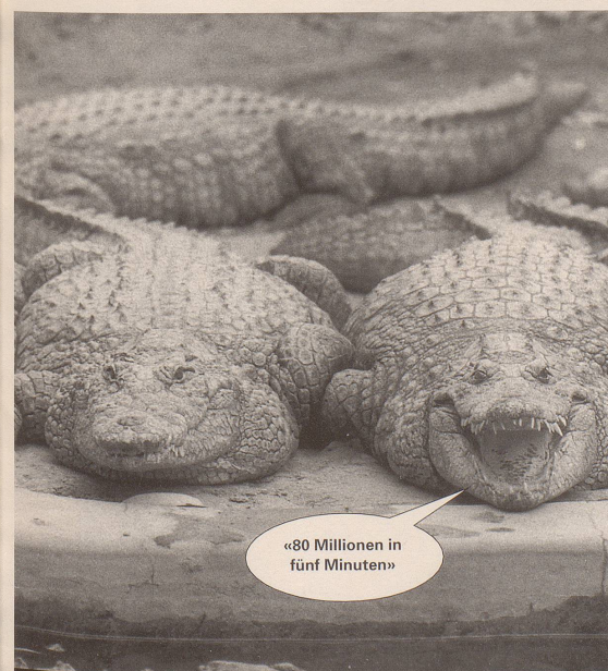
6. Und die Aktionäre pressen ...