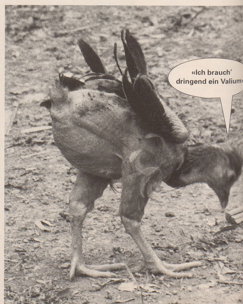
5. ... viele lassen.