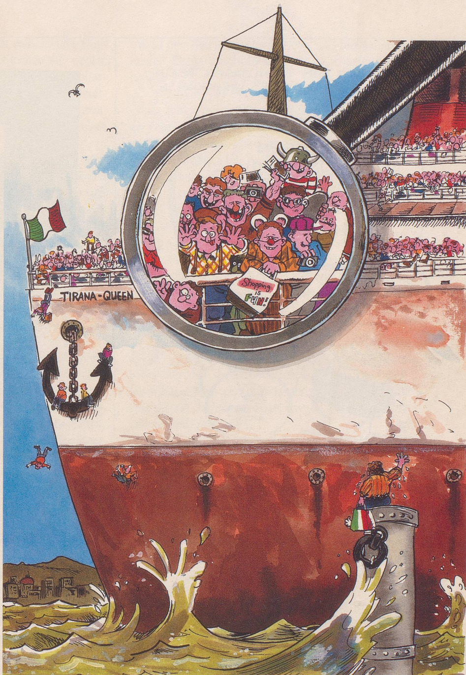
Albanische Humorarbeit unter der Lupe: Enormer Detailreichtum selbst in zweitklassigen Produktionen