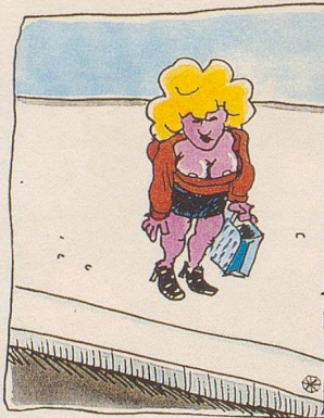
AUSSICHT VON OBEN