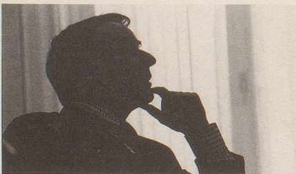
Augenblicke mit Adolf Ogi. Fotos von Walter Rutishauser. Seite 19

Wollt Ihr die totale Kuh? Lilaswiss, ich sage nur lilaswiss! Von Linard Bardill (Text) und Werner Nydegger (Illustration). 42