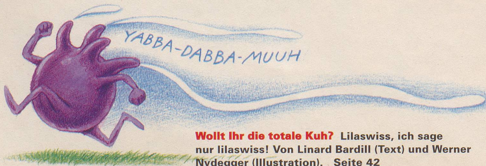
Wollt Ihr die totale Kuh? Lilaswiss, ich sage nur lilaswiss! Von Linard Bardill (Text) und Werner Nydegger (Illustration). Seite 42