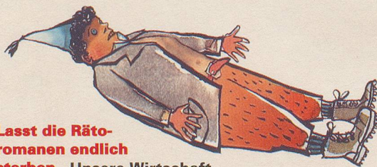
Lasst die Rätromanen endlich sterben. Unsere Wirtschaft geht vor die Hunde – und jetzt sollen wir auch noch das Rätromanische zur Teil-Amtssprache aufwerten und dabei ein paar Millionen Franken an Subventionen verlochen? Seite 12