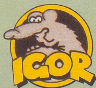
Abbildung in Originalgrösse