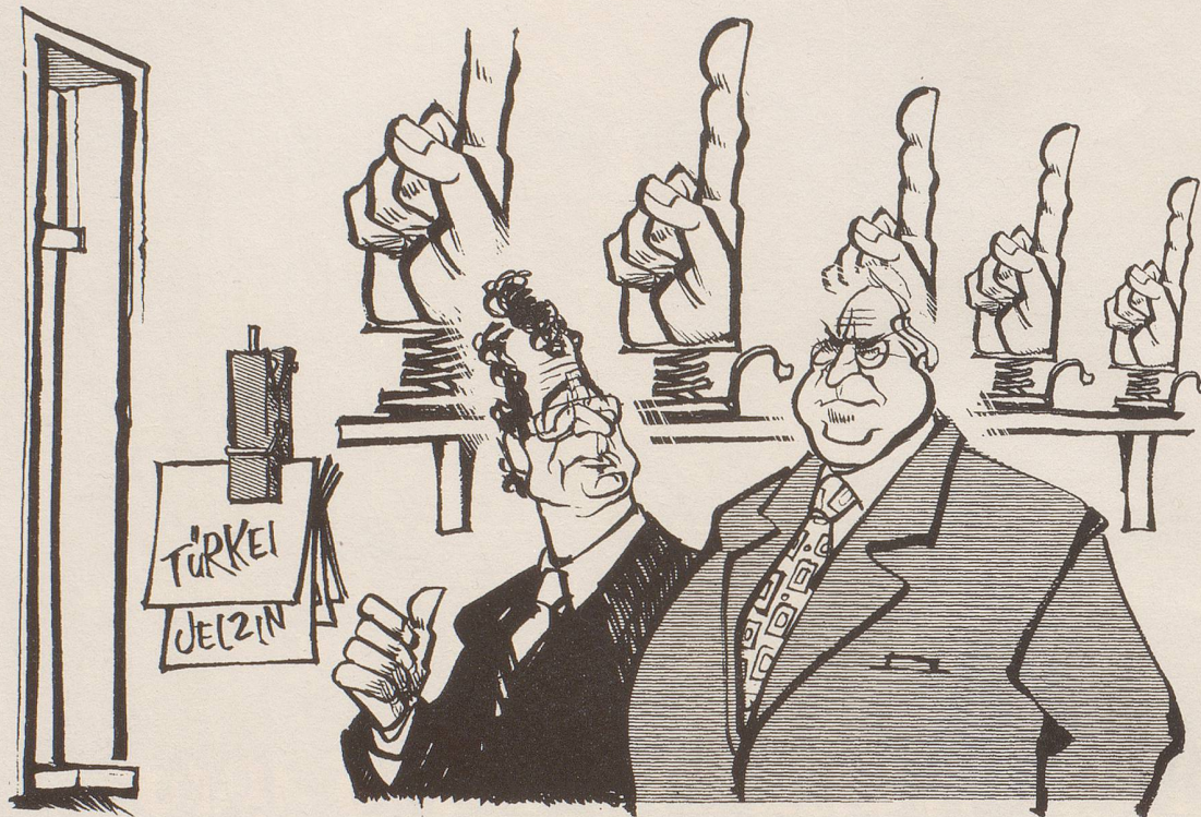
«Welchen halten wir denn heute für wen aus dem Fenster?»