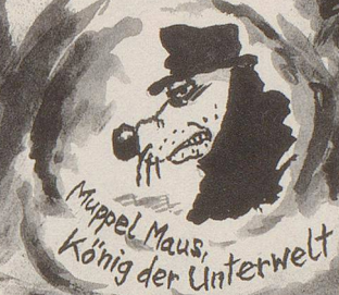
Moppel Maus, König der Unterwelt