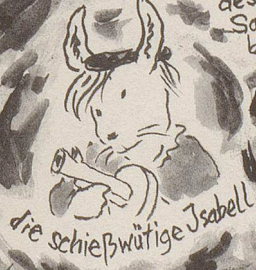
die schießwütige Isabell