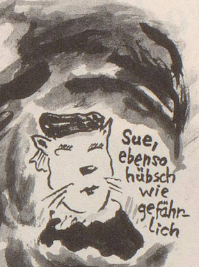
Sue, ebenso hübsch wie gefährlich