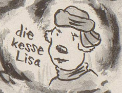
die kessre Lisa