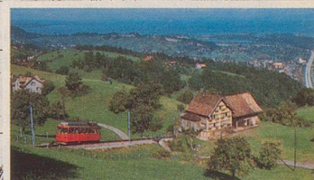
Bergbahn Rheineck-Walzenhausen RhW 9410 Heiden, Tel. 071/91 14 92 Rheineck – Walzenhausen

Reproduziert mit Bewilligung des Bundesamtes für Landestopographie vom 1. Juni 1993