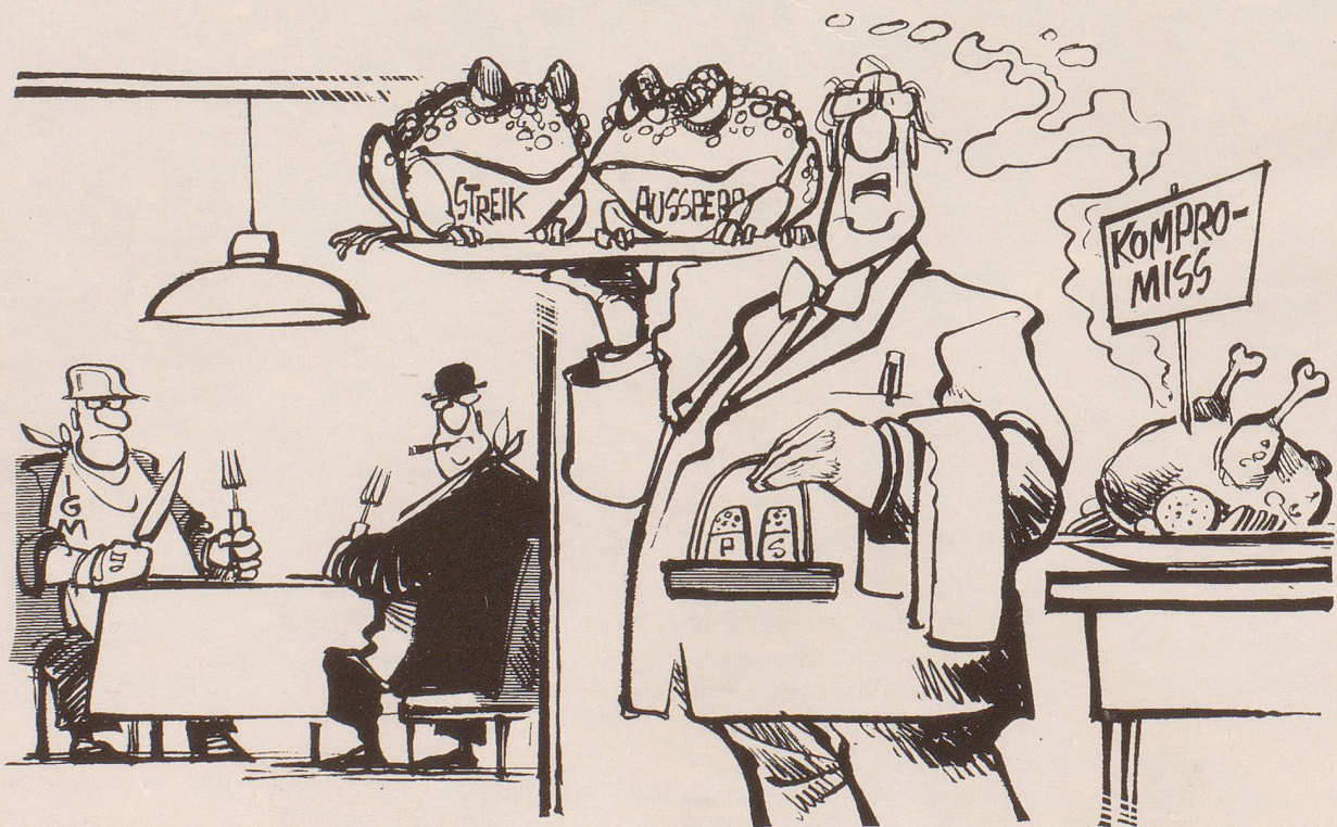
«Die Herren bestehen auf Vorspeise!»