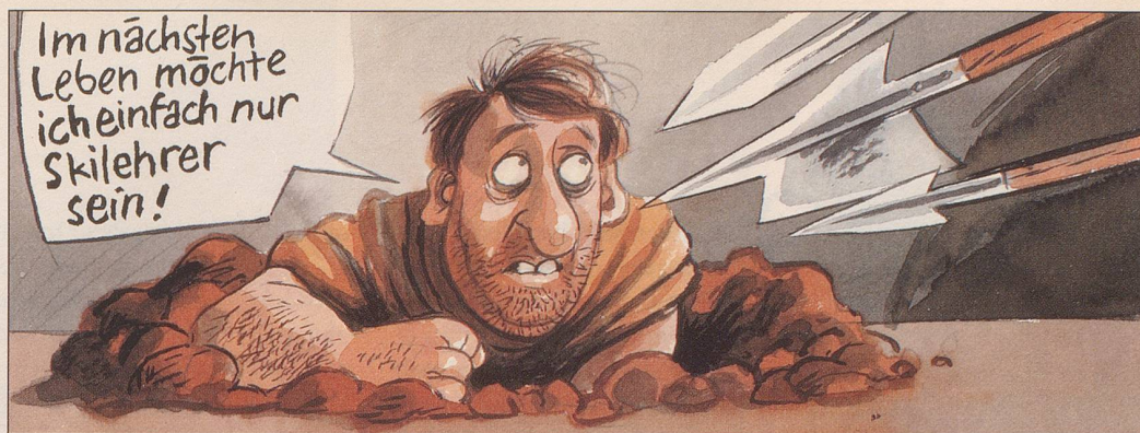
IWAN RASCHLE/ERNST FEURER-METTLER

aber wegen fehlerhafter Berechnungen inmitten des Wachlokals das Tageslicht, worauf er ausgerufen haben soll: «Hätte ich doch zwei Löcher gegraben!» Ob ihm das tatsächlich zur Flucht verholfen hätte, ist aus heutiger Sicht zwar höchst zweifelhaft, zeigt uns aber eindrücklich, dass Dölfs Gedankengänge schon damals eher slalomartig verliefen.