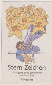
Franz Eder Stern-Zeichen Cartoons 96 S., Fr. 12.80