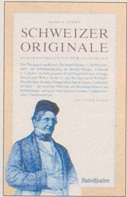
Hans A. Jenny Schweizer Originale Zweiter Band Weitere Porträts helvetischer Individuen 128 S., Fr. 14.80 2. Auflage