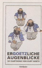
Kurt Goetz Ergoetzliche Augenblicke 101 Cartoons 128 S., Fr. 14.80