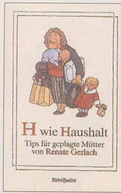
Renate Gerlach H wie Haushalt Tips für geplagte Mütter 94 S., Fr. 12.80 2. Auflage