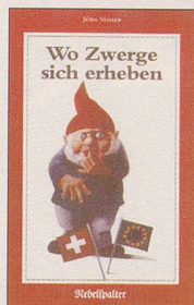
Jürg Moser Wo Zwerge sich erheben Satiren 128 S., Fr. 14.80