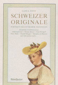
Hans A. Jenny Schweizer Originale Erster Band Porträts helvetischer Individuen, 120 S., Fr. 14.80, 3. Auflage