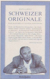
Hans A. Jenny Schweizer Originale Dritter Band Noch mehr Porträts helvetischer Individuen 128 S., Fr. 14.80 2. Auflage