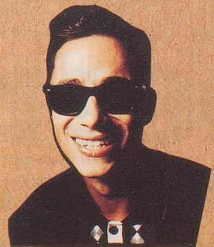
La Mamma hat's.