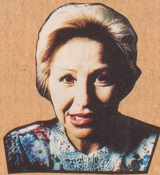
In Mallorca haben sie's nicht.