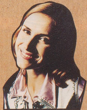
Der Mieter von Nebenan hat's.