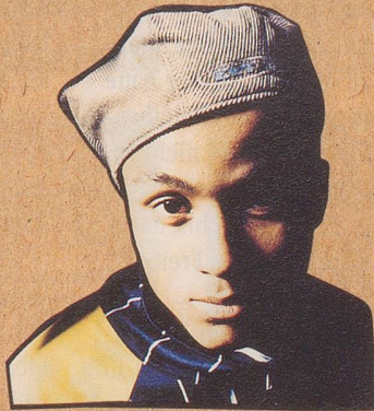
Seine Leadsängerin hat's.