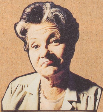
Ihre Haushilfe hat's nicht.