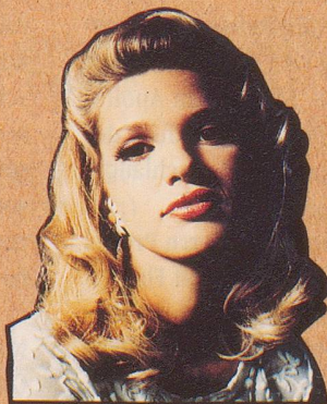
Ihr Hausmann hat's.