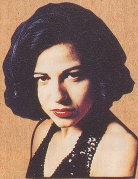
Der mit den weissen Socken hat's nicht.