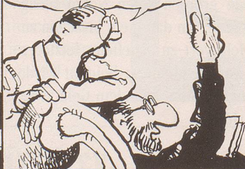
BILD 3... JA... ABER... DAS IST DIE FALLE! DIE FALLE, DIE MAN MIR STELLEN WILL...!