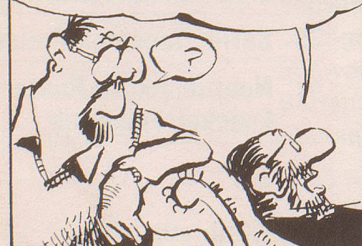
BILD 1... DAS... DAS ERINNERT MICH AN DAS PARTEI-PROGRAMM DER FDP...