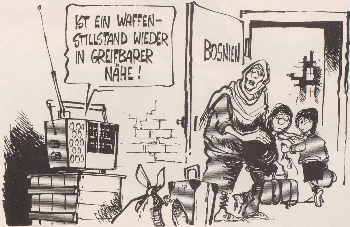
«... dann nichts wie ab in den Luftschutzbunker, Kinder!»