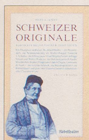
Hans A. Jenny Schweizer Originale Zweiter Band Weitere Porträts helvetischer Individuen 128 S., Fr. 14.80 2. Auflage