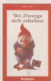
Jürg Moser Wo Zwerge sich erheben Satiren 128 S., Fr. 14.80