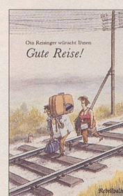
Otto Reisinger Gute Reise! Cartoons 108 S., Fr. 12.80 2. Auflage