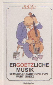
Kurt Goetz Ergoetzliche Musik 99 Musiker-Cartoons von Kurt Goetz 128 S., Fr. 9.80 2. Auflage