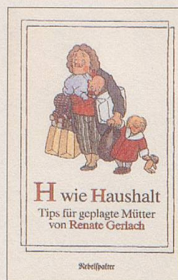
Renate Gerlach H wie Haushalt Tips für geplagte Mütter 94 S., Fr. 12.80 2. Auflage