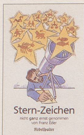
Franz Eder Stern-Zeichen Cartoons 96 S., Fr. 12.80