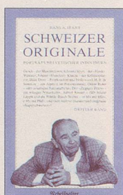
Hans A. Jenny Schweizer Originale Dritter Band Noch mehr Porträts helvetischer Individuen 128 S., Fr. 14.80 2. Auflage