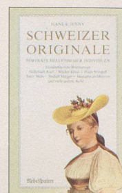
Hans A. Jenny Schweizer Originale Erster Band Porträts helvetischer Individuen, 120 S., Fr. 14.80, 3. Auflage