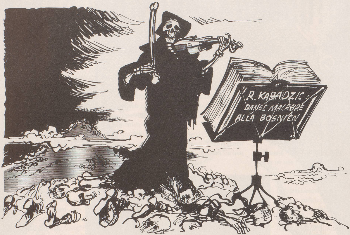
« ... und nun noch als Zugabe den Kroatischen Marsch von Franjo Tudjman! »