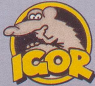
Abbildung in Originalgrösse