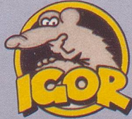
Abbildung in Originalgrösse