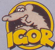
Abbildung in Originalgrösse