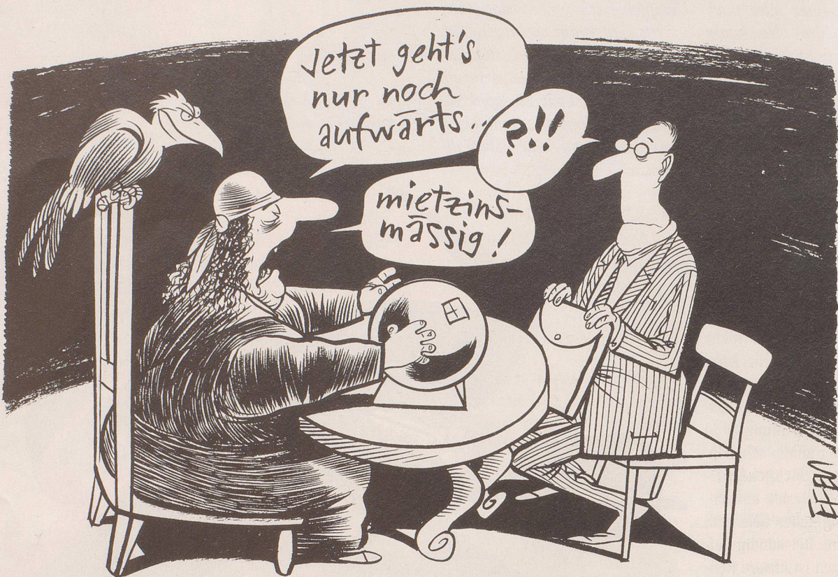
Hypothekarzins-Senkungen müssen (laut Bundesgericht) nicht mehr an die Mieter weitergegeben werden.