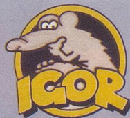
Abbildung in Originalgrösse