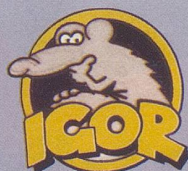
Abbildung in Originalgrösse