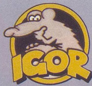
Abbildung in Originalgrösse