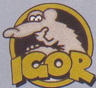
Abbildung in Originalgrösse