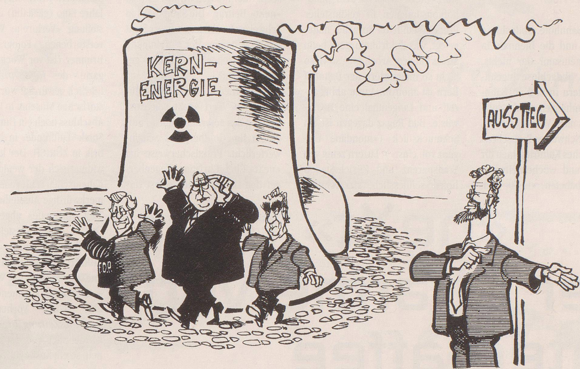
«Immer noch nicht kapiert, dass wir hier eingemauert sind?!»