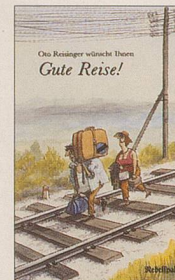
Otto Reisinger Gute Reise! Cartoons 108 S., Fr. 12.80 2. Auflage