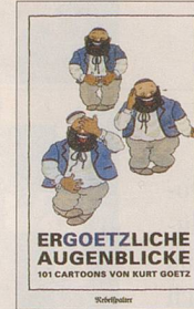
Kurt Goetz Ergoetzliche Augenblicke 101 Cartoons 128 S., Fr. 14.80