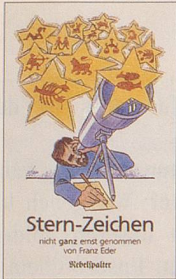
Franz Eder Stern-Zeichen Cartoons 96 S., Fr. 12.80