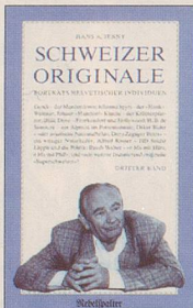
Hans A. Jenny Schweizer Originale Dritter Band Noch mehr Porträts helvetischer Individuen 128 S., Fr. 14.80 2. Auflage