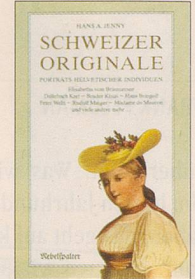
Hans A. Jenny Schweizer Originale Erster Band Porträts helvetischer Individuen, 120 S., Fr. 14.80, 3. Auflage