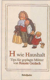
Renate Gerlach H wie Haushalt Tips für geplagte Mütter 94 S., Fr. 12.80 2. Auflage