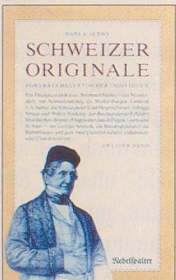
Hans A. Jenny Schweizer Originale Zweiter Band Weitere Porträts helvetischer Individuen 128 S., Fr. 14.80 2. Auflage