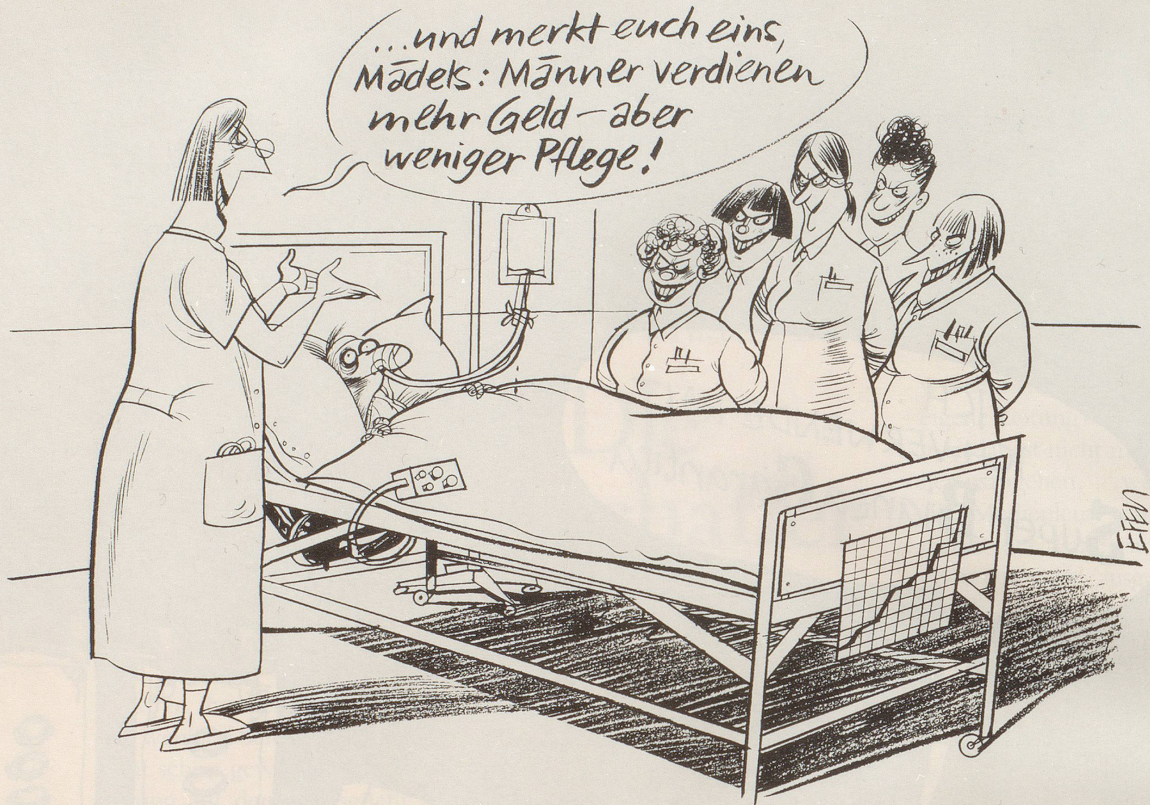
Die mögliche Rache der schlechter besoldeten St.Galler Pflegepersonal-Ausbilderinnen an den Berufsschullehrern ...